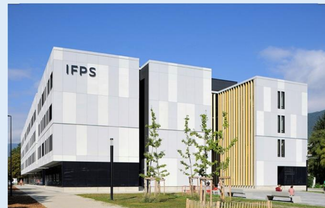
Institut de Formation des Professionnels de Santé